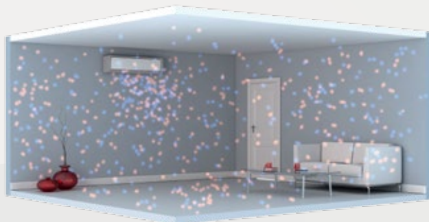
Aktiv jonbaserad luftrening skapar positiva och negativa joner som bryter ner luftföroreningar.

Den patenterade luftreningsfunktionen i värmepumpen bygger också på ett naturligt fenomen. Den utnyttjar samma processer som gör luften extra ren och frisk runt ett vattenfall eller i en lövskog. Finessen kallas för PlasmaCluster och innebär att skadliga partiklar i luften oskadliggörs och ger samma upplevelse av frisk luft inomhus. Funktionen neutraliserar allt från virus, bakterier och tobaksrök till kvalster, damm och andra allergiframkallande ämnen.