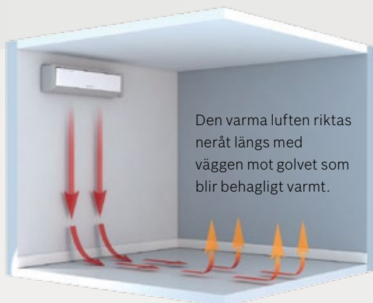
Varma luftströmmar i fulleffektsläge.